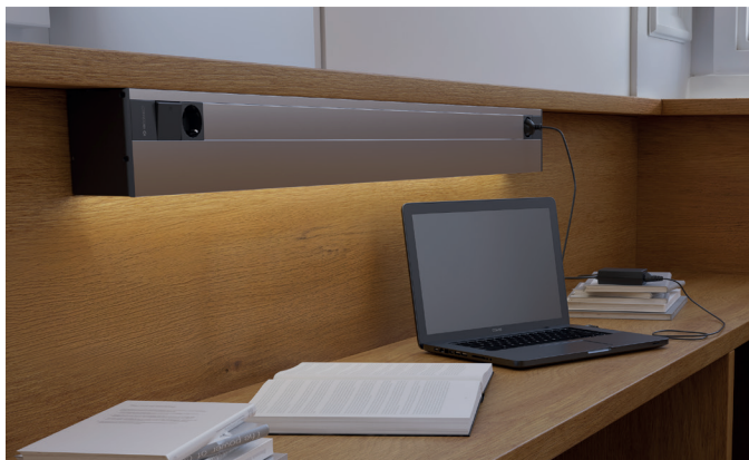
ES. Lumen instalado en una mesa de biblioteca, combinando iluminación y enchufes.