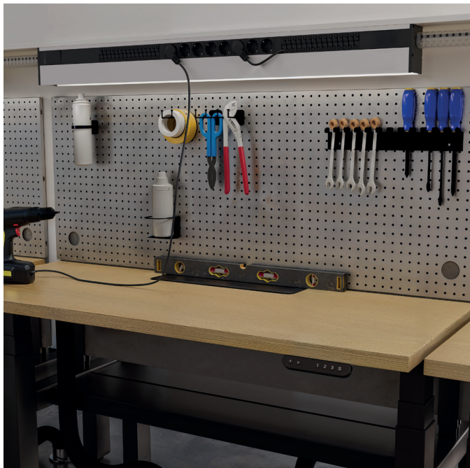
ES. Lumen instalado en mesa de trabajo.